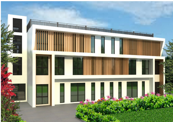
センター完成イメージ図

今回の寄贈は、ミャンマーにおける高齢者介護の人材開発とその発展を目的に2017年より進められている、京進とミャンマー社会福祉省との共同事業の更なる拡大のための増設として決定されました。開設される介護研修センターは当面、これまでも現地で介護や日本語教育を行ってきた京進 JETC が運営し、介護技能実習・特定技能を念頭に置いた研修やプログラムを実施していきます。京進 JETC からは、これまでも100人以上の介護分野の技能実習生や留学生在が育っています。